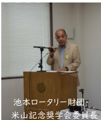
池本ロータリー財団・ 米山記念奨学会委員長