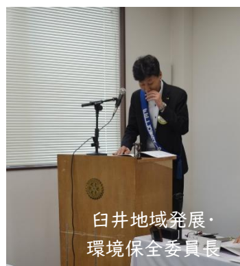
白井地域発展・ 環境保全委員長