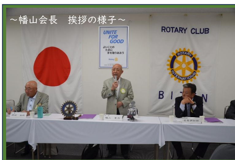
～幡山会長 挨拶の様子～