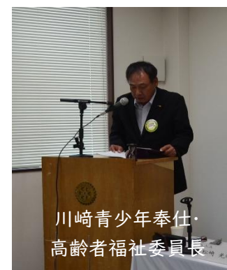
川崎青少年奉仕・ 高齢者福祉委員長