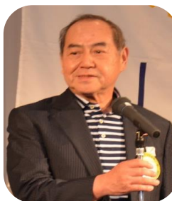
開会の挨拶 長崎会長